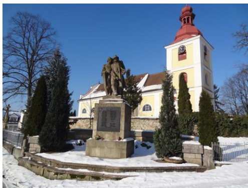
Slatina nad Zdobnicí